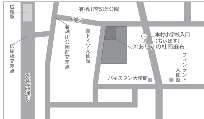
【交通アクセス図】② ありすの杜南麻布

※東京メトロ日比谷線「広尾駅」1・2番出口 徒歩7分 ※港区コミュニティバス(ちいばす)麻布ルート「本村小学校入口」徒歩2分