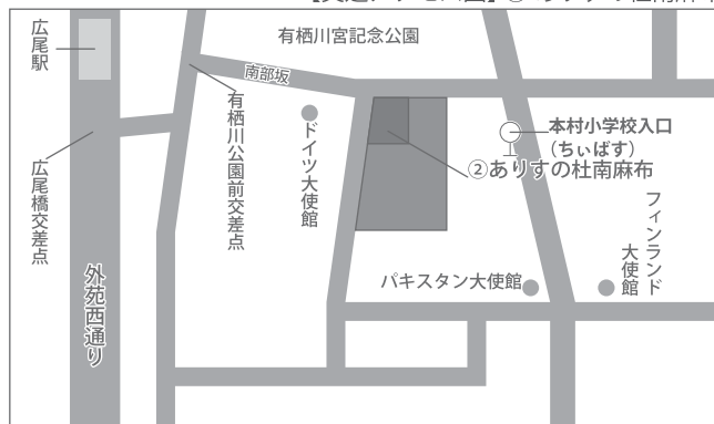
【交通アクセス図】② ありすの杜南麻布

※東京メトロ日比谷線「広尾駅」1・2番出口 徒歩7分 ※港区コミュニティバス(ちいばす)麻布西ルート「本村小学校入口」徒歩2分