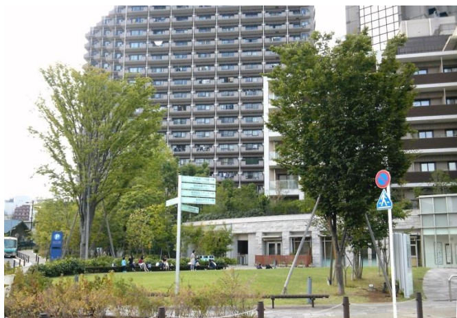
F 台地へ上がると景観が一変します。