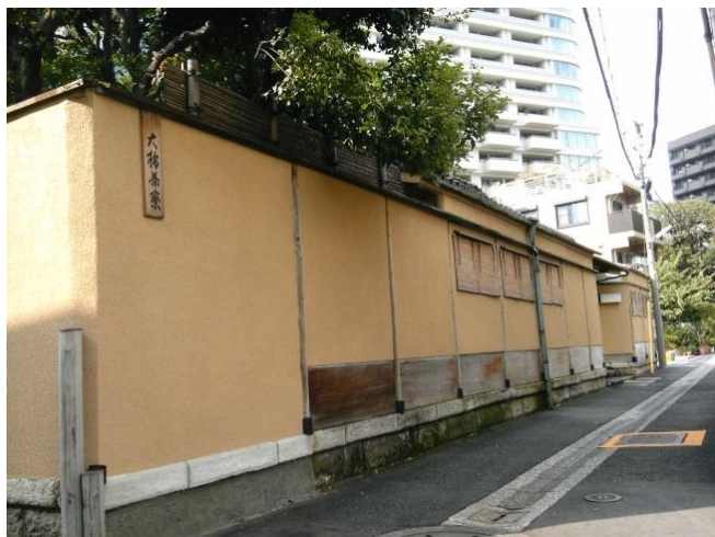
G 台地の上には、粋な茶寮もありました。