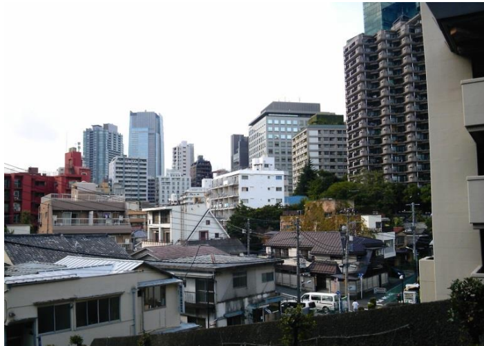
B 南の台地上から見た我善坊谷と周囲の高層ビル群