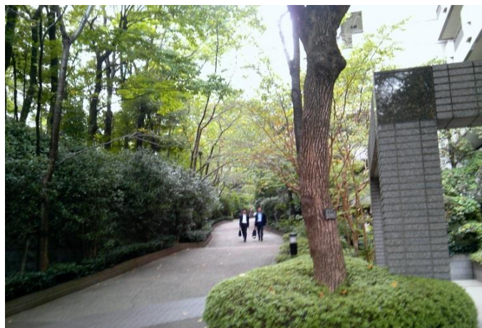
H 近くの城山ヒルズの歩道。我善坊谷も再開発後はこのような景観になるのでしょうか。