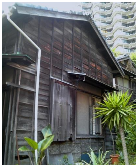
E 木造民家も少数ながら見られました。