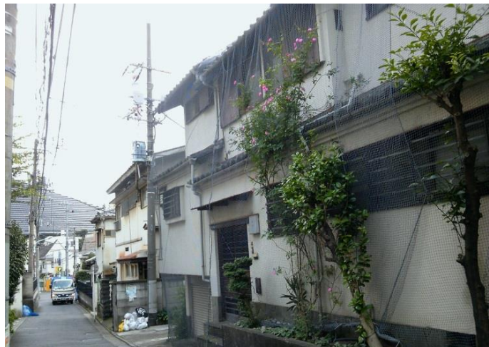
D 住宅の多くは立ち退き後のようでした。