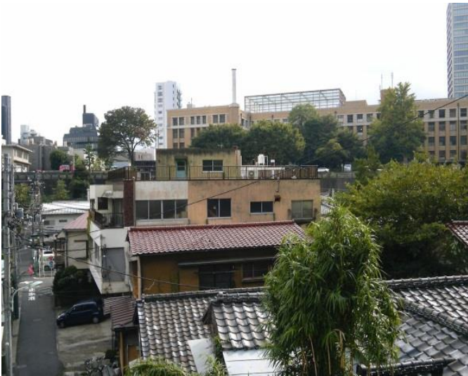
A 北の台地上から見た我善坊谷の西部