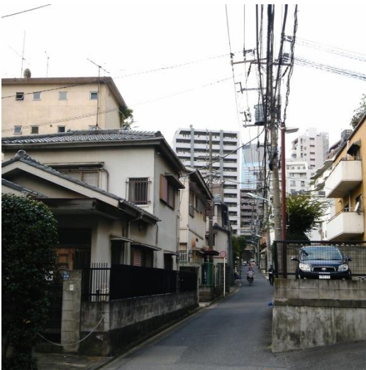
C 現在の我善坊谷の平均的な景観