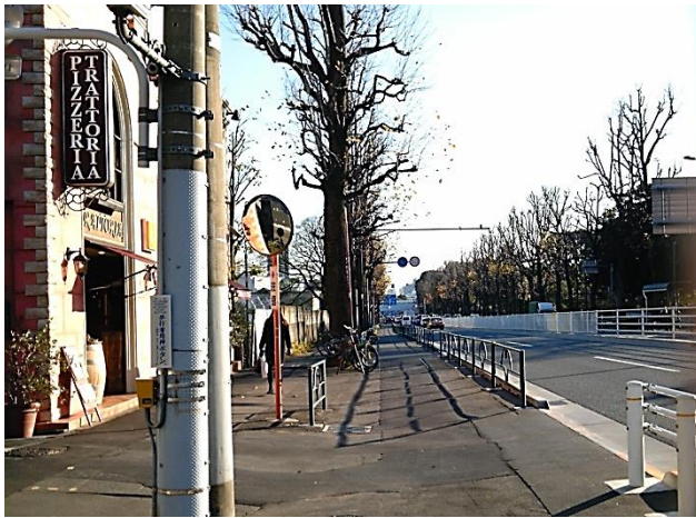
E ここから南へ1キロ弱の自転車専用道が整備されていきました。左から歩道、自転車道、車道。