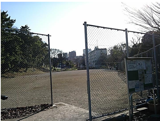
G 都立青山公園(南地区)。グラウンド中心の構成のためか北地区に比べて利用者は少なかった。