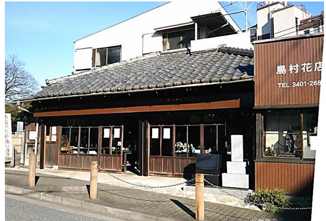
B 青山霊園南端に位置する瓦屋根の趣ある花店。