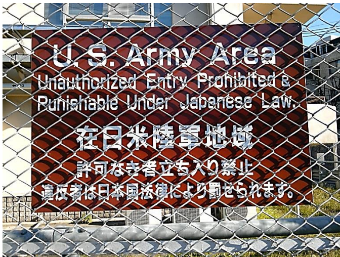
C こんなところに在日米陸軍地域。