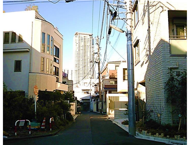
F 南青山一丁目の住宅地の景観。北を望む。