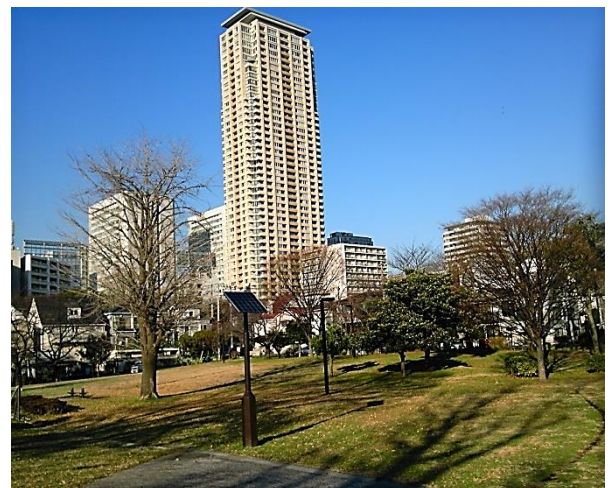
H 都立青山公園(北地区)。高層ビルは三井不動産のパークアクシス青山一丁目タワー。