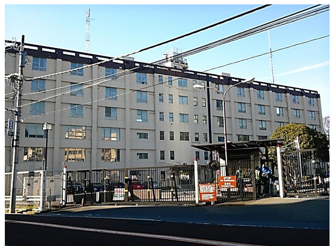
D 米陸軍宿舎、ヘリポート、プレスセンターがあるそうです。