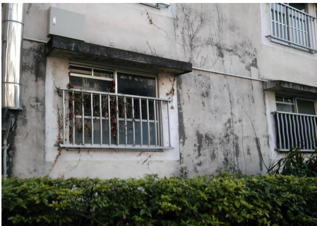
G かなり老朽化し、退去した部屋も目立つ。