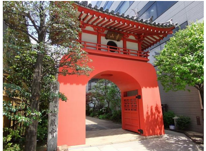
B これも相当にインパクトがある海蔵寺の山門。(北青山2丁目)