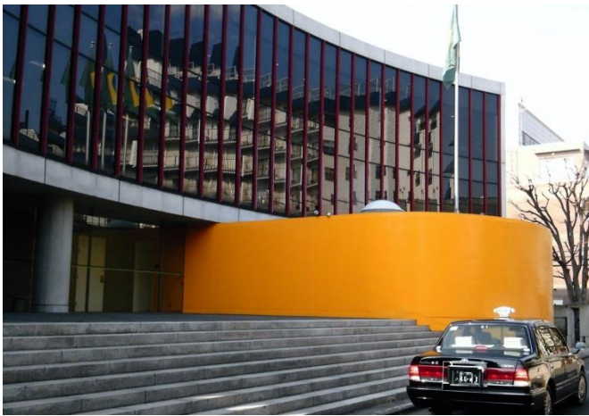
A かなりのインパクトがある駐日ブラジル大使館の建物。(北青山2丁目)