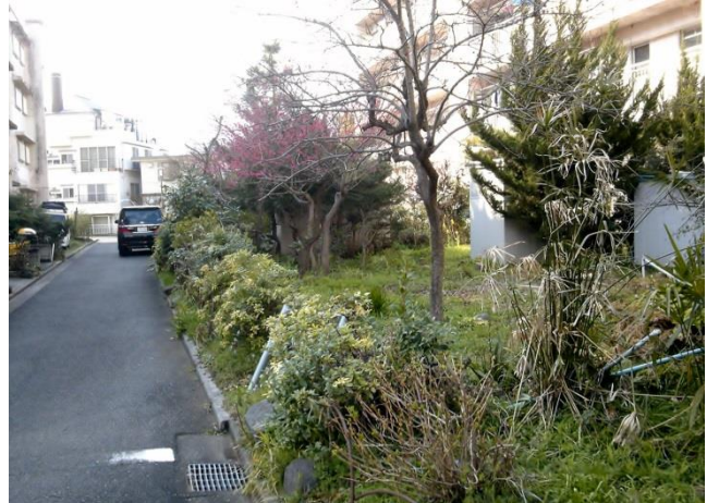
H 住棟の前庭もかなり放置されて様子でした。