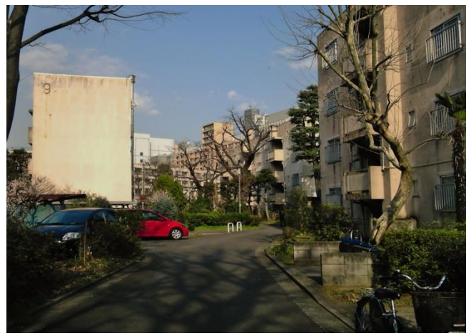
F 団地内はゆったりとしていました。