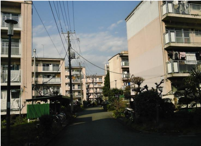
E 住棟は中層なので空が広く感じられる。