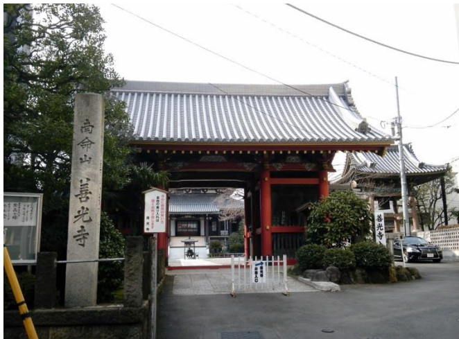
C 善光寺東京別院。表参道交差点にほど近い。青山七福神の一つでもある。(北青山3丁目)