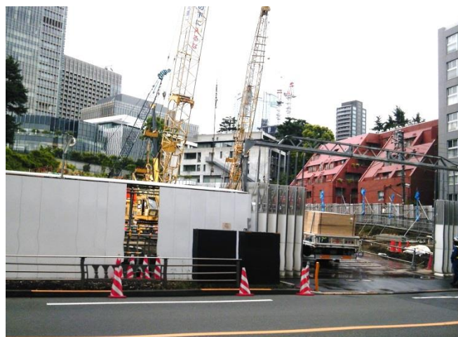
B 三井不動産によるパークコート赤坂檜町ザ・タワーの建設現場。44階建てで2018年竣工予定。