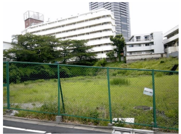
J カナダ大使館近くはかなり広い空地。東京都の管理ですが、何になるのでしょうか。