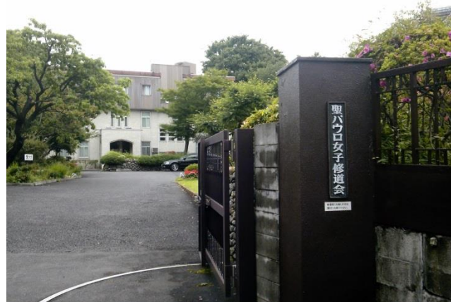
C 乃木會館先の静かな脇道を登ると聖パウロ女子修道会がありました。