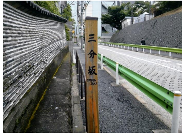
F 法土寺脇の三分坂。左の練塀は港区の文化財。