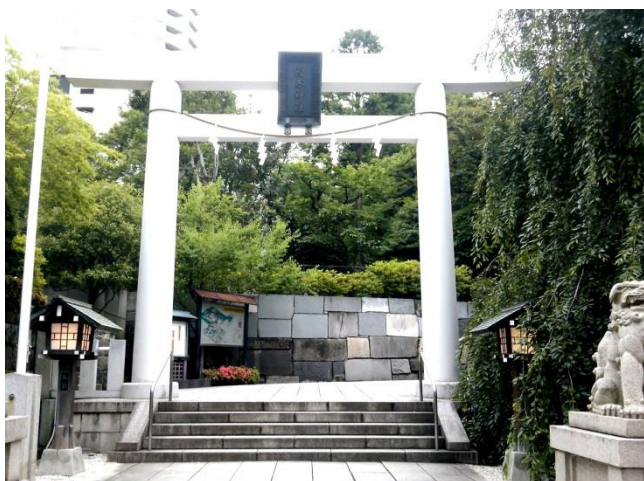
A 乃木神社の一の鳥居。神社に隣接して旧乃木邸等があり、見どころの多い神社です。