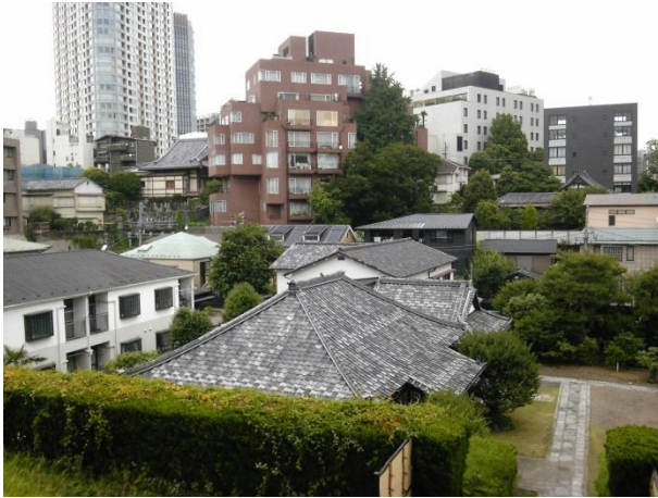
E 種徳寺裏の高台から北側を望む。左奥は三井不動産のパークコート赤坂ザ・タワー。