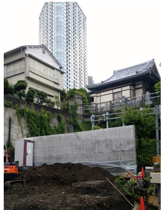
H 低地から台地を見上げる。右の寺院は導教寺。