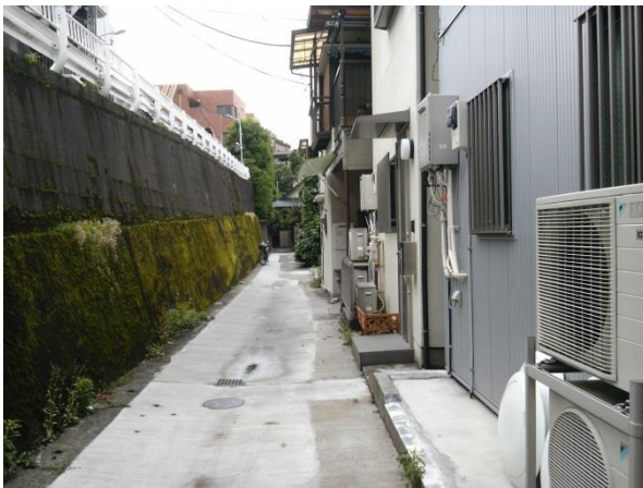
K 今回のエリアでは珍しい通り抜けできる路地。カンボジア大使館近く。