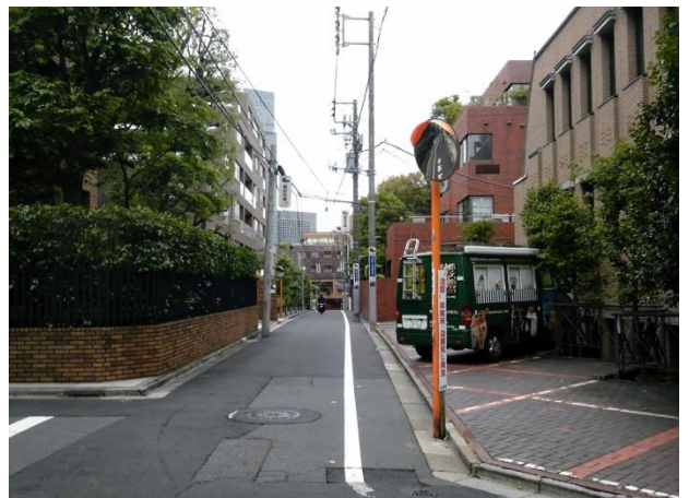
L 青山通りの1本南側はマンション街でした。