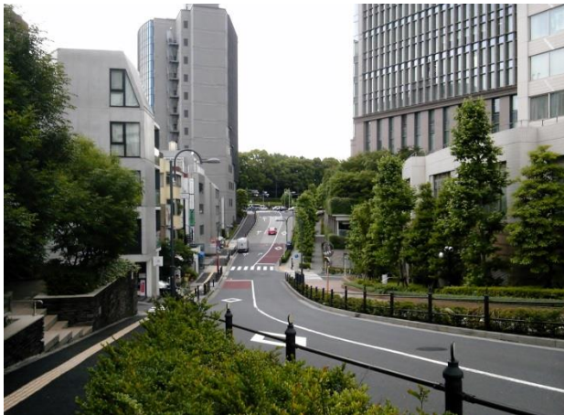
G 薬研坂。いったん下って、上りかえす。