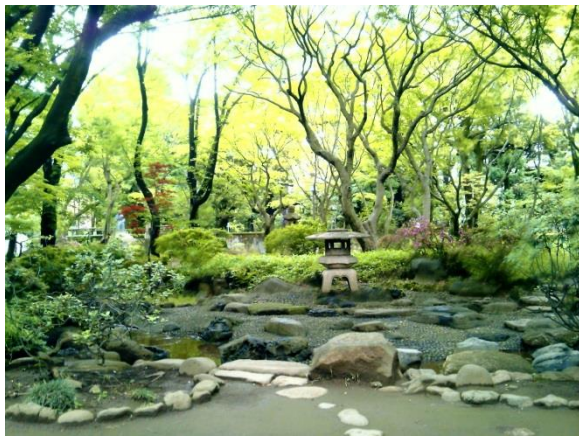
I 高橋是清翁記念公園。