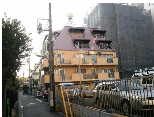
H 幹線道路から1本なかに入った景観。