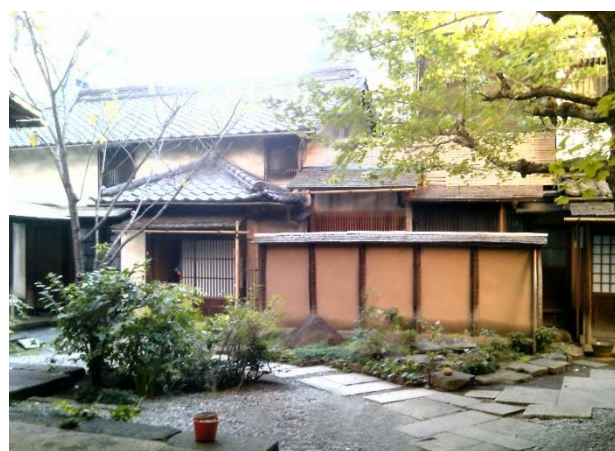
F 大門近くの浄運院の境内。落ち着いた空間です。