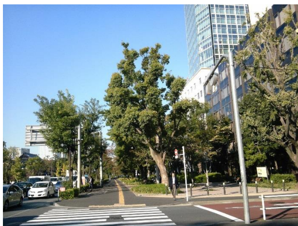
G 桜田通りの東側の緑道化された歩道。