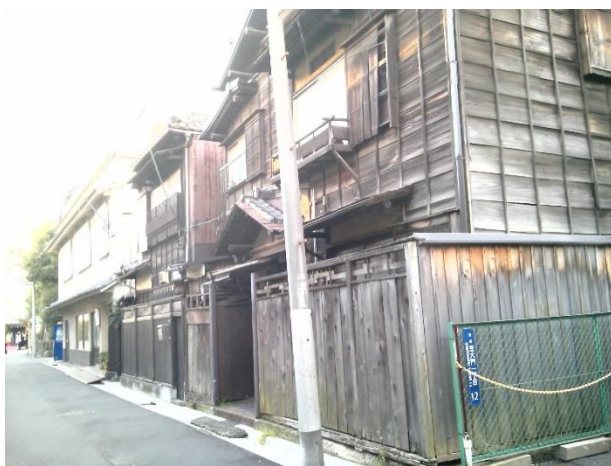
C 芝大神宮周辺で唯一見られた昔ながらの景観。