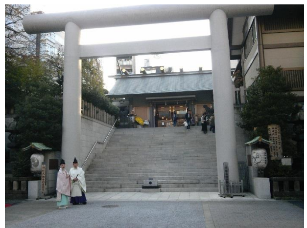
B 芝大神宮。1005年創建、1598年現在地に奉遷。