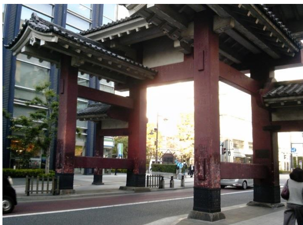
E 増上寺の総門である大門。