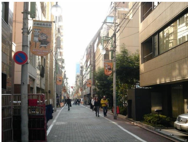
A 芝神明商店会。このあたりの典型的景観。